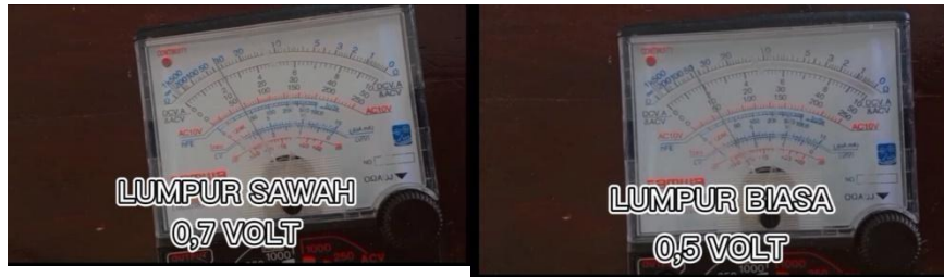
Gambar 4.5 Perbandingan Jumlah Tegangan Listrik