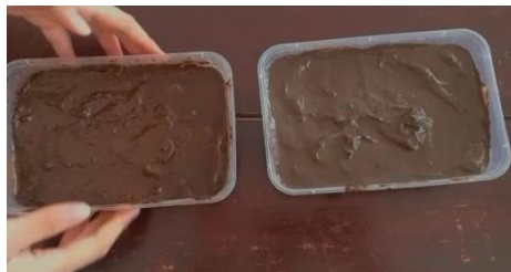
Gambar 4.1 Persiapan Lumpur Sawah dan Lumpur Biasa