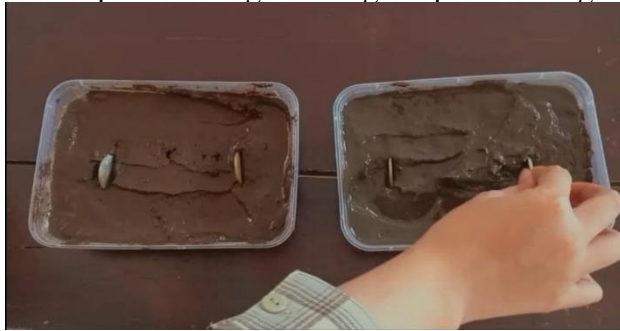
Gambar 4.3 Penancapan logam dan Tembaga