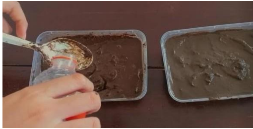
Gambar 4.2 Pemberian Air Garam